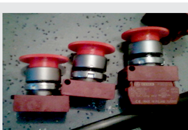
Ilustración 1. Pulsador de contacto

Los diámetros de la sombrilla del cabezal seta disponibles en el mercado son de 40 mm y 60 mm.