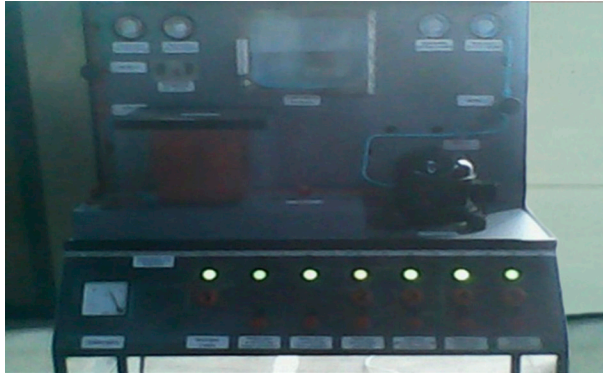
Ilustración 4, Prototipo final

Se muestra también el diagrama eléctrico del prototipo: