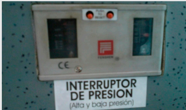
Ilustración 2. Interruptor de presión

El nuevo ajuste cambia los puntos de funcionamiento alto y bajo, pero siempre deberá estar ajustado en el punto de funcionamiento bajo, el ajuste de la tuerca (A) aumenta girándola en sentido de las manecillas del reloj.