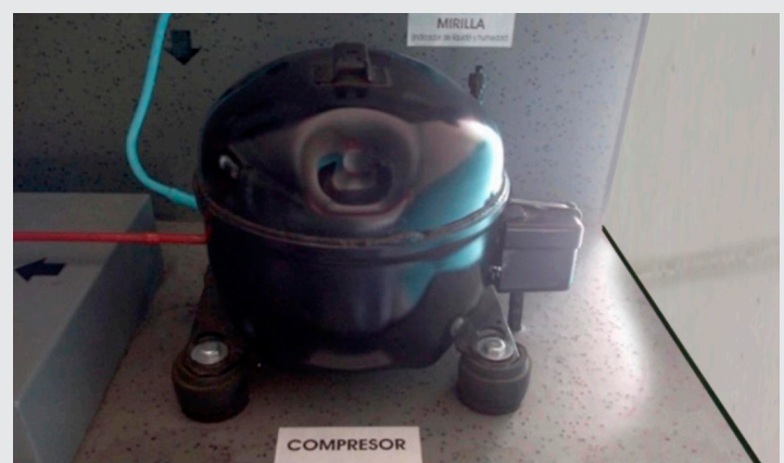
Ilustración 3. Compresor

Un compresor es una máquina de fluido que está construida para aumentar la presión y desplazar cierto tipo de fluidos llamados compresibles, tal como lo son los gases y los vapores. Esto se realiza a través de un intercambio de energía entre la máquina y el fluido en el cual el trabajo ejercido por el compresor es transferido a la sustancia que pasa por él convirtiéndose en energía de flujo aumentando su presión energía cinética impulsándola a fluir.