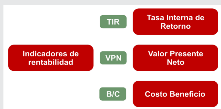
Figura 2. Indicadores de rentabilidad financiera

B/C>1 : Los beneficios por realizar el proyecto son superiores a los costos del proyecto por lo que se considera viable.