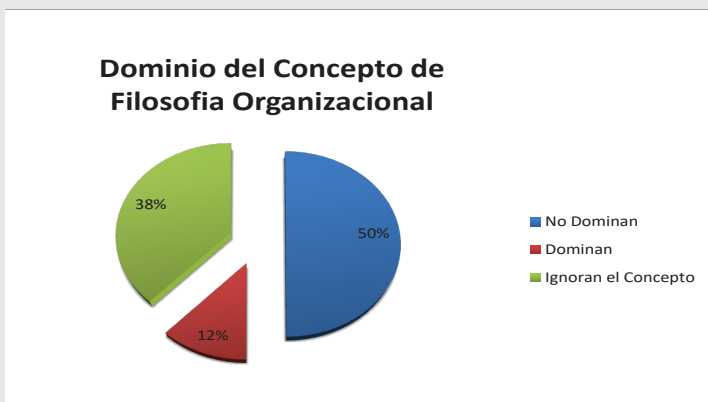
Gráfica 1. Dominio del concepto de filosofía organizacional

3.-El desarrollo de competencias laborales en los alumnos fue evidente desde el momento que se encontraron motivados por el dominio del tema y el contacto con las personas en las organizaciones. gráfica 2.