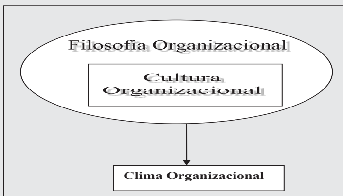
Figura 1. Relación entre filosofía, clima y cultura organizacional.

Después de un semestre en el cual los alumnos guiados por los académicos, aplicaron en el campo de la práctica las bases de una filosofía organizacional dinámica, se obtuvo lo siguiente: